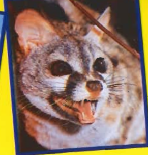
Linsantza zuhaitzetan bizi da. Isatsa gorputza bezaín luzen du.