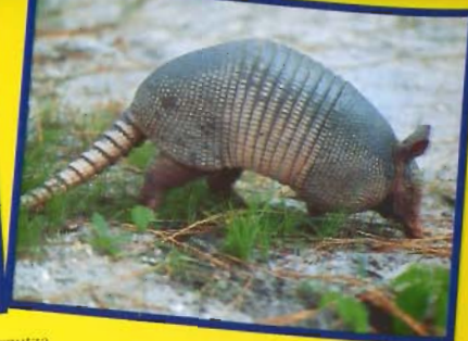
Armadilloa salbu sentitzen da soin-burdin azpian