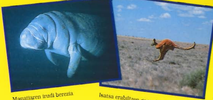
Manatiaren trudi berezia