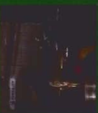
egiten diren lanak

Ikasmaterial honen Hezkuntza, Unibertsitate eta Ikerketa Sailaren egokitasun-aitormena du. Data: 2010/05/11